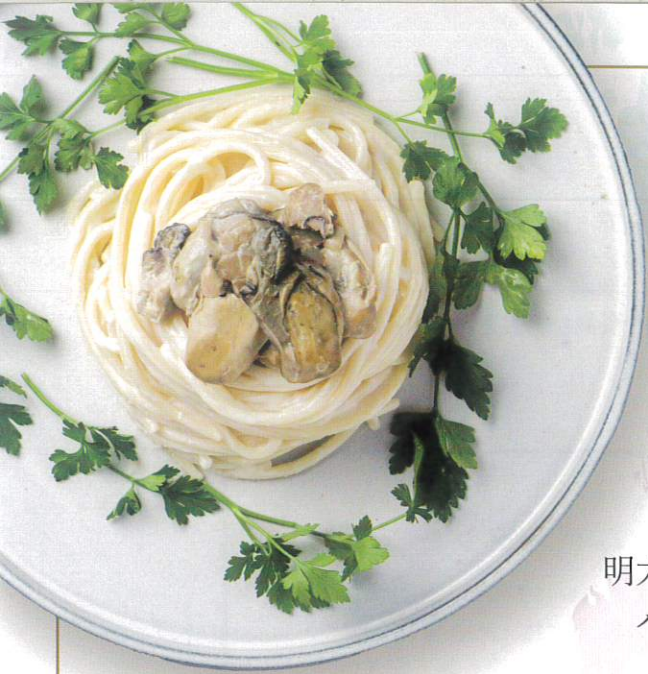
牡蠣のクリーム パスタソース